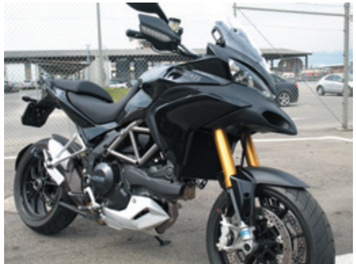
Agressive et prête à bouffer du bitume.

Avant de signer le chèque, on sera tenté, et c'est normal, de la comparer avec la référence en matière de trail, la BMW 1200 GS. Bien que l'allemande est soignée sa sonorité cette année et apportée quelques améliorations, le choix dépendra du mode de conduite, de son attachement à une marque plutôt qu'une autre. Pour les électrons libres, il faudrait les comparer avec la Ducati mais uniquement en mode Touring, ou la Ducati 1200 Multistrada de base et au prix équivalent. En mode Sport, la Ducati lâche tout ces chevaux et devient une autre moto. Et là je pense à la chanson de Grand Corps Malade, « mon cœur, ma tête et mes couilles ». Mon cœur penche pour la Ducati, la tête pour la BMW (répu-