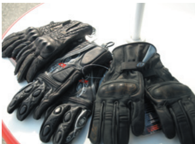
Les 3 paires de gants.

P our partir en voyage, une sacoche très pratique. Soulevez la selle pour y glisser les 2 sangles, relier les sangles au sac, serrer les sangles, et le tour est joué.