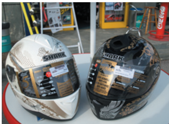
Les casques Shark blanc et noir avec une décoration destinée à la clientèle féminine.