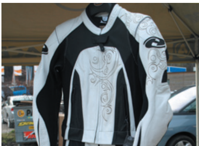
La combinaison blanche « racing » en cuir avec les motifs.