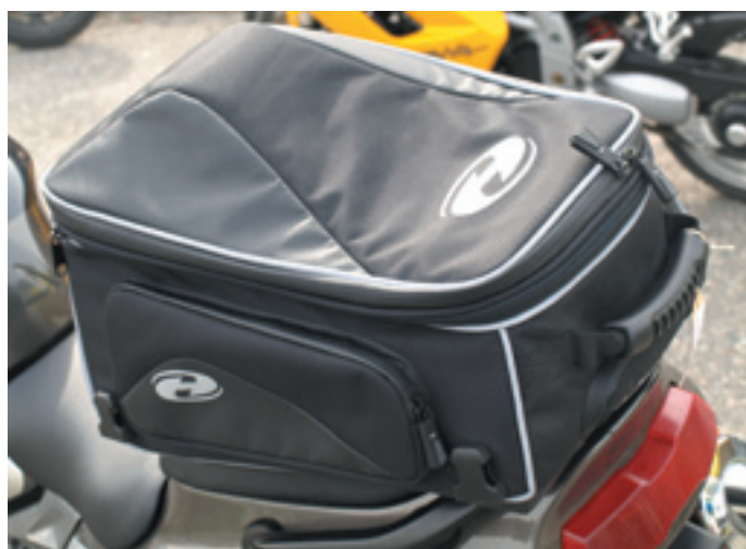
Contenance : jusqu'à 26 litres.

Sac étanche avec poches sur les côtés et fermetures étanches.