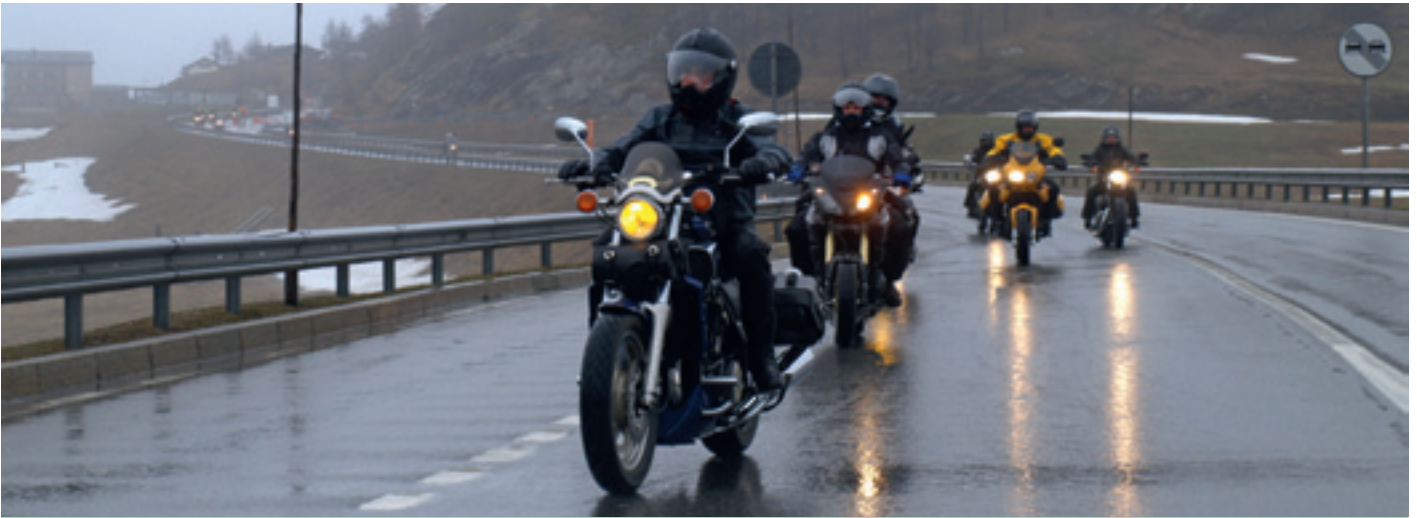
Ankunft der Motorräder im Regen.