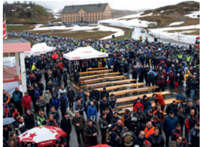
600 motards de tous âges et horizons étaient présents.

Certains ont regrettés l'ancien prêtre qui officiait la