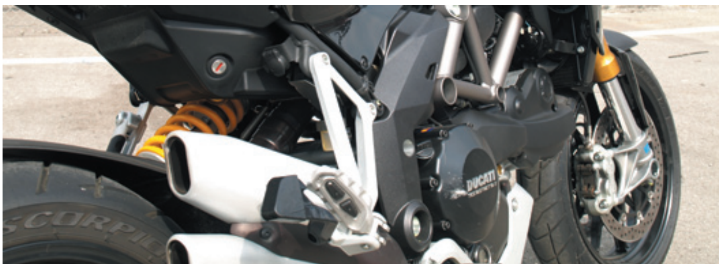
Un avion de chasse hors du tarmac de l'aéroport.