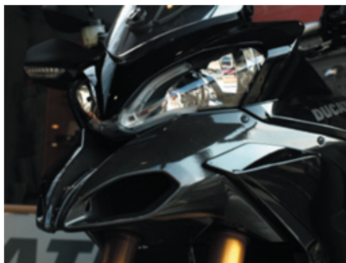
C'est pas un bec de canard, mais plutôt de faucon.

duro, mais je n'ai pas été en tout terrain. Le moteur s'ébroue, le son est bien celui d'une Ducati, et présent. Le mode Urban me permet de sortir de Genève, sans que le moteur cogne sur les bas régimes, tout en souple. La moto est fine, la prise en main est évidente et la selle est accueillante. Avec un mètre huitante deux sous la toise, je n'ai pas de problème pour poser les pieds des deux côtés de la moto lors des arrêts au feu rouge. L'autoroute de contournement, la vitesse s'élève, et je passe en Touring. Le moteur conserve sa souplesse et les accélérations sont vigoureuses mais en souple. La sonorité de l'échappement remplace n'importe quelle radio. Voilà une moto sur laquelle les échappements resteront de série. Le mode Sport délivre