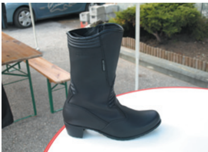
Bottes de moto à talons hauts.

Lors de ma visite chez A+Moto, j'ai demandé à Gaëlle de bien vouloir nous présenter quelques modèles pour femmes. Voici donc sa sélection :